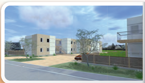
Plan d'un type 3

Cible environnementale BBC Bâtiment Basse Consommation