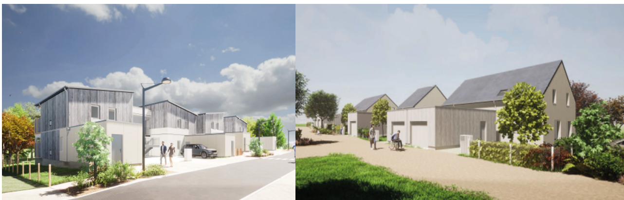
Premières esquisses du projet

Stellaria, une opération de logements locatifs sociaux et de logements en accession sera lancée d'ici la fin de l'année 2023, ZAC Les Ecotières à Villevêque.