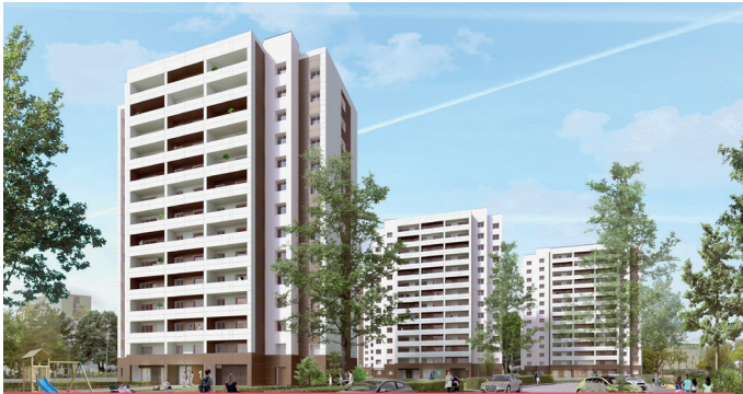
Perspective des tours Gaubert réhabilités