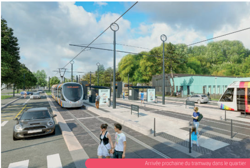
Arrivée prochaine du tramway dans le quartier

- La nouvelle piscine qui devrait être livrée pour l'été 2024 à proximité du centre Jacques Tati qui a déjà été agrandi.