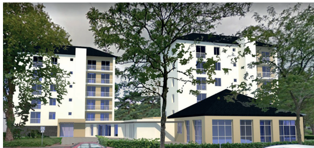
Perspective de la réhabilitation de la résidence Arceau

- La résidence Arceau. Elle compte 28 logements et 2 salles communes. Les travaux, qui s'achèveront en juin 2022, portent sur la mise en conformité et la sécurisation des locaux ; l'amélioration de l'accessibilité et du confort thermique des logements et des parties communes ; la construction d'une extension pour relier les deux bâtiments et la réorganisation des espaces pour les rendre plus fonctionnels ; la privatisation du jardin.