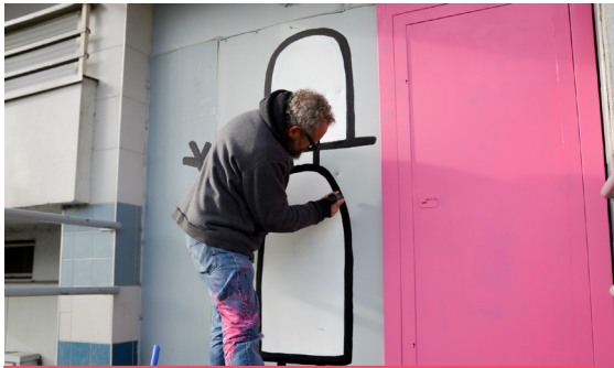
Réalisation des scènes de vie par Botero Pop

L'office a utilisé la façade de l'immeuble pour permettre à l'artiste Botero pop de réaliser une fresque représentant des tranches de vie vécues ici. Quatre mécènes ont participé au financement de cette oeuvre : Aethica, Groupe Launay, Pichet, Groupe Arc.